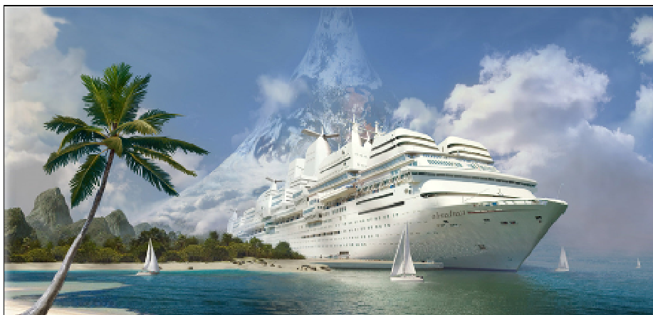
Slika 5. Prikaz modernog broda za kružna putovanja

Brodovi za krstarenje mogu se klasifikovati na temelju područja njihove namjene na morska i riječna plovila. Postoje različiti načini za kategoriziranje plovila. Dije se prema veličini, poslovnim modelu i uobičajenom načinu života gostiju. Ovisno o interesima, starosnoj dobi i financijskim mogućnostima gostiju brodovi mogu biti namijenjeni za luksuzni ugođaj, avanture, obrazovanje, kulturu, zabavu, športske aktivnosti, wellness ili rekreaciju. Veličina broda, oprema i posada na brodu je prilagođena ciljnoj skupini turista.