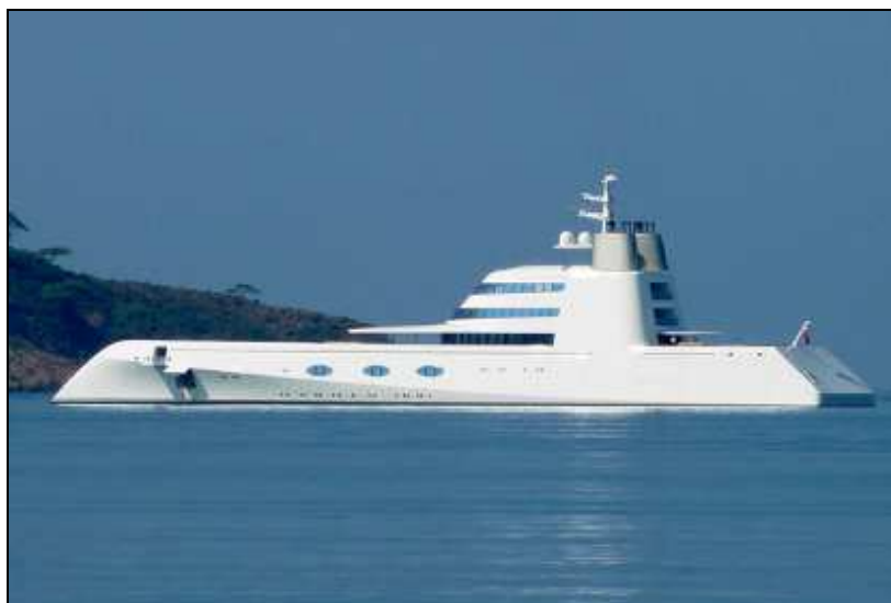
Slika 4. Izgled savremene megajahte

Luksuzne jahte danas imaju mnogo proizvođača i trgovačkih predstavnika iznajmljivača,, dok se na samom vrhu popisa proizvođača jahti u Evropi nalaze brendovi kao Ferretti, Azimut, AzimutBenetti, Sunseeker ili, recimo, Lürssen. Inače, danas sve jahte duljine preko 30 metara (100 ft) s profesionalnom opremom nose naziv luksuzne ili super jahte, a sam termin luksuzne ili mega jahte pojavio se još početkom 20 st., kada su imućniji slojevi društva ovakva skupocjena plovila počeli proizvoditi za lične potrebe. Luksuzne ili mega jahte nemaju svoje pristanište pa se njihovi vlasnici moraju registrirati u pristanište države pod čijom zastavom plove. Velike se jahte obično zadržavaju u pristaništu onoliko koliko je potrebno da ih posada održava, i dok čekaju da vlasnik ili gosti stignu, a nakon toga uvijek slijedi kraće putovanje.