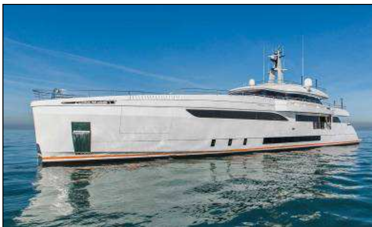
Slika 3. Izgled savremene jahte

Jahte su obično uređene prema odgovarajućim standardima, ali često i prema željama samog vlasnika. Unutrašnjost jahte može biti mala i skućena, ali i vrlo prostrana, ovisno o njevoj veličini. Sve veće jahte imaju salone, spavaće sobe za vlasnika, goste i posadu, kuhinju, WC sa kupatilima itd.