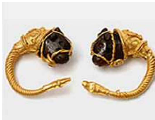
Zlatne minduše (IV-III vijek stare ere)

„Tokom I i II vijeka, duž pristupnog puta Budvi, razvila se nekropola s grobnim alejama urađenim po uzoru na groblja velikih gradskih centara, na primjer u Saloni ili Akvileji. Tu su se, gotovo u pravilnim redovima, nizale nadzemne porodične grobnice u vidu malih edikula ili stepenastih piramida krunisanih nadgrobnim spomenicima, žrtvenicima ili kupastim cipusima.“ 17