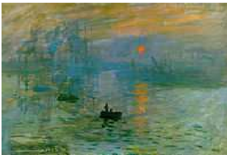
Slika br. 3: Claude Monet, Impresija, izlazak sunca, 1872., Musée Marmotan, Pariz.

Impresionizam je škola slikanja koja se razvila u Francuskoj krajem 19. vijeka. Umjetnici kao što su Camille Pissarro (1830.-1903.) i Claude Monet (1840.-1926.) i Auguste Renoir (1841.-1919.) slikali su svoje impresije kratkog vremenskog odsječka, a posebno promjene što ih izaziva sunčevo svjetlo. U početku su ih kritikovali, budući da su gledaoci očekivali slike s više detalja, no kasnije su postali vrlo uticajni. Sredinom 19. vijeka umjetnici su počeli raskidati s tradicijom koju su utemeljile prijašnje generacije. Dok su im prije njihovi zaštitnici, koji su ih plaćali, govorili što će slikati, oni su sad počeli stvarati ono što su željeli, a potom pokušavali svoje radove prodavati.