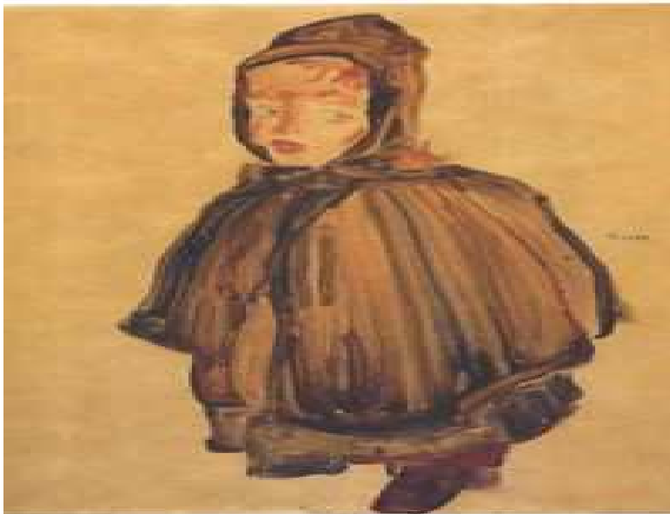
Slika br. 11: Egon Schiele: Djevojčica s kapom

Pored ovih što smo u predhodnim poglavljima naveli, njemačkom ekspresionističkom krugu pripadaju još i njemački slikari Max Beckmann i Paula Modersohn-Becker, kao i austrijski slikari Oskar Kokoschka i Egon Schiele, specifični po svom slikarskom izrazu. Kokoschkin stil vjerno je prikazao gusto namazane boje i debele slojeve istih, što je bila znakovita odlika ekspresionističkog slikarstva, uz određenu dozu mašte, dok je Schieleov stil prepun nakaradnih i deformiranih prikaza (načelno su to bili ekspresionistički portreti) preko kojih autor izražava svoje ogorčenje.