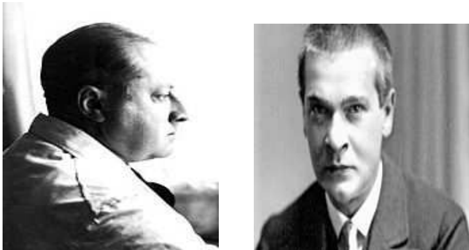
Slika br. 13: Gottfried Benn i Georg Trakl

karakteristične i za ostale avangardne pravce (futurizam, nadrealizam, dadaizam - izuzetak su imažinizam i konkretna poezija). 51