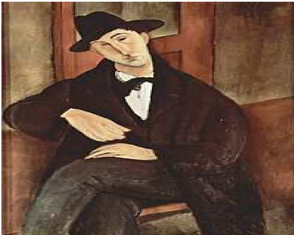
Slika br. 12: Amedeo Modigliani: Portret Marija Varfoglija

Kada je riječ o francuskom ekspresionizmu u slikarstvu, francuski su ekspresionisti u svom izrazu bili znatno umjereniji i nisu imali nekakvu specifičnu grupnu homogenost već su djelovali nezavisno, a elemente njihovog slikarstva slijedili su i brojni strani slikari koji su se okupljali u Parizu, tadašnjem kulturnom središtu. Georges Rouault značajan je po svojim deformisanim i unakaženim prikazima punih bunta koje je prenosio i na religijske (Izbičevani Krist), ali i na svjetovne teme u kojima je prikazivao likove s dna društvene ljestvice (prostitutke, ulične artiste). 48