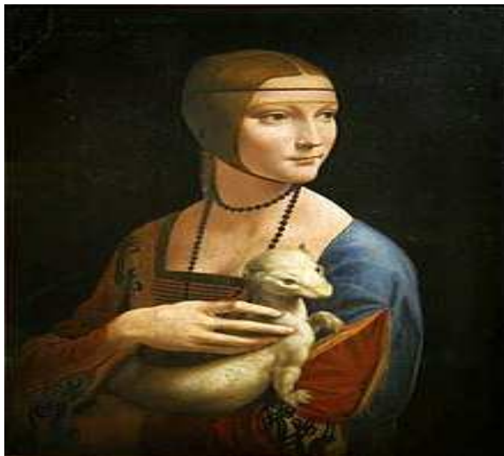
Slika br.2: Leonardo da Vinci, Dama s hermelinom, Muzej Czartoryski, Kraków

djela. U isto vrijeme izumljene su štamparije, koje su omogućile dostupnost knjiga širim slojevima društva, a šira primjena baruta je mijenjala način ratovanja i gradnje skloništa. Takođe su započela velika geografska otkrića i razvoj slobodnih nauka, kao što su astronomija i fizika, koji su pridonijeli detaljnijem razumijevanju svijeta. Društvo se takođe više okreće razumijevanju čovjeka, a odnos prema religiji se mijenja u protestantskoj reformaciji. 18