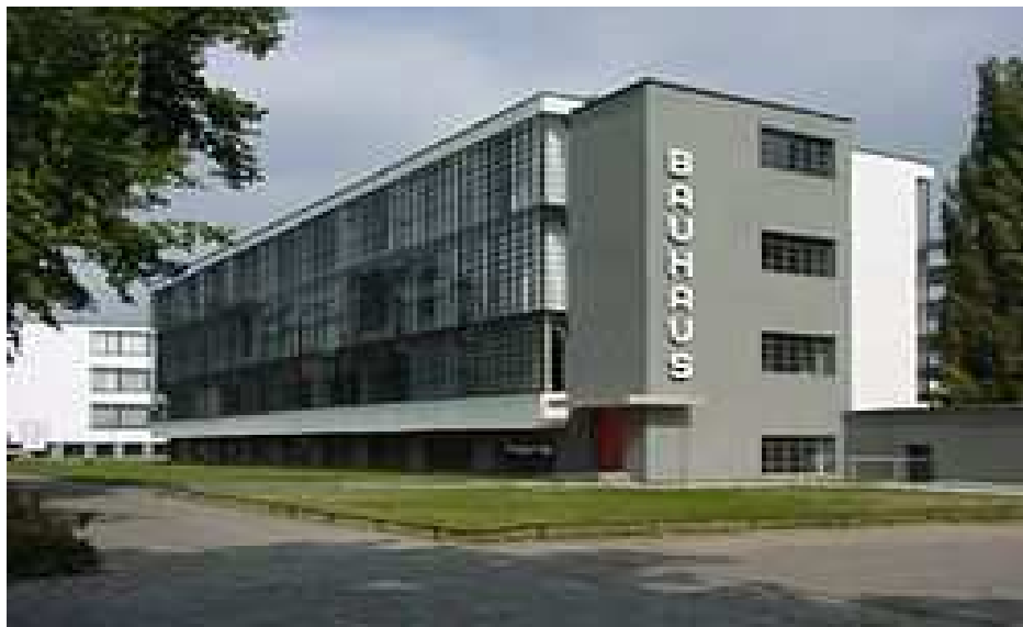
Slika br. 8: Zgrada Bauhauasa u Desau, 1919.-1926., Njemačka.

Grupa Plavi jahač (Franc Mark, Avgust Make, Gabrijela Minter, Vasilij Kandinski, Paul Kle i Aleksej Javlenski), čije ime dolazi od jedne slike Kandinskog, bila je ujedinjena više po traženju duhovnog u slikarstvu, nego po stilu i formi. Njihova djela, koja se karakterišu po eksperimentu i originalnosti, otvaraju vrata apstraktnoj umjetnosti.