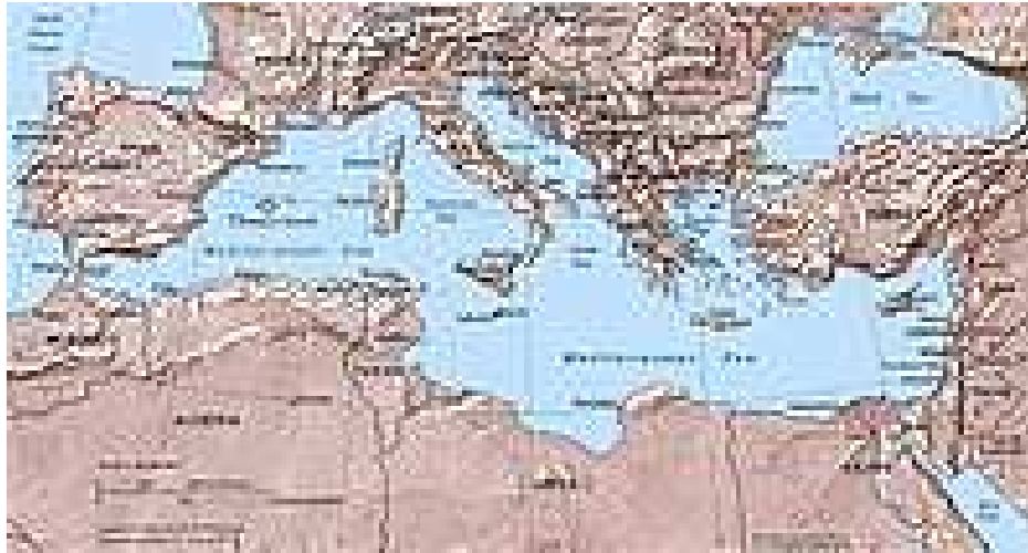
Slika br.1: Sredozemlje