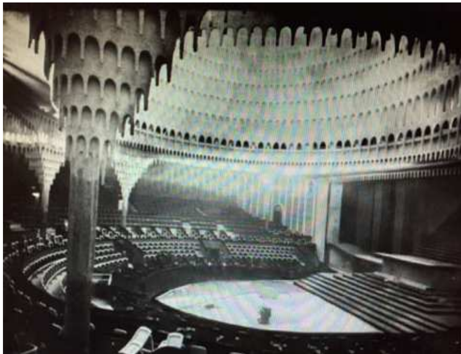
Slika br. 16: Hans Pelzig Veliko pozorište, Belin, 1919.