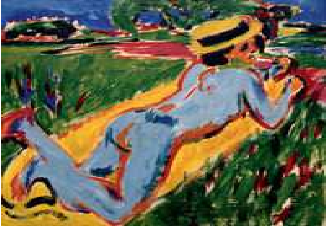
Slika br.9: Ernst Ludwig Kirchner: Plavi akt

tačnije 1895., izradio je crno-bijelu verziju Vrisak uz obrazloženje da jedino bezbojnost doista može iznijeti pravo značenje vriska. 45