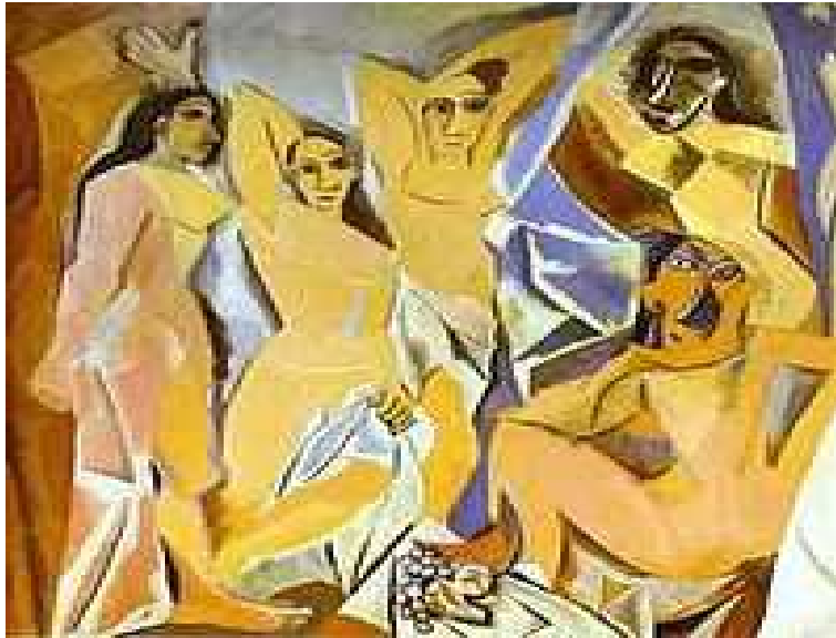
Slika br. 6: Gospođice iz Avignona koju je naslikao Pablo Picasso 1907. god. se smatra prvim potpuno modernim djelom 20. Vijeka