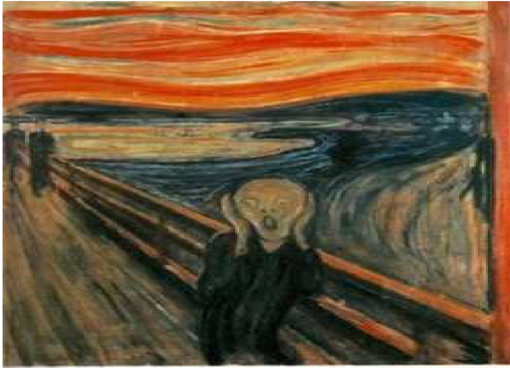
Slika br. 7: Edvard Munk – Vrisak

Paralelno sa fovistima u Francuskoj, njemački umjetnici su osjećali da kao proroci dotada nepoznatih umjetničkih vrijednosti, moraju prevazići konvencije koje sputavaju umjetnost njihovog doba. Temelj slikarstva u Evropi za narednih pedeset godina bio je izražen u ciljevima tri grupe njemačkih umjetnika: Most, Plavi jahač i Nova stvarnost. Ekspresionizam ovih umjetnika je proistekao iz protesta prema društvenim i političkim nepravdama. U djelima u kojima su protestovali protiv nepravdi svog vremena, nastojali su da se što neposrednije ogleda snaga njihovog stvaralačkog poriva. Ovaj stvaralački poriv, združen sa željom za protestom, postao je temelj čitavog niza raznih pokreta u njemačkoj umjetnosti. Umjetnički oblici koji su nastajali kao rezultat ovoga stanja poprimali su kvalitete žestine, dramatičnosti, okrutnosti i čak fanatizma koji, na primjer, u „razumnoj“ francuskoj umjetnosti, uprkos tadašnjoj percepciji fovizma kao „divljeg“ likovnog izraza, se nije nikada u potpunosti javljao. 35