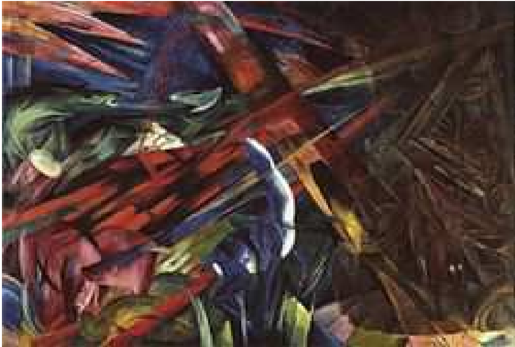
Slika br. 10: Franz Marc: Sudbina životinja

Kada je riječ o Drugoj ekspresionističkoj grupi, "Der Blaue Reiter" (Plavi jahač) osnovana je u Münchenu 1911. godine. Ime su dobili po istoimenoj slici Vasilija Kandinskog, ruskog slikara koji je emigrirao u Njemačku, koji s Franzom Marcom formulira estetske vrijednosti grupe. Iste godine kad i osniva grupu, Kandinski, koji je bio vrsni teoretičar, kasnij profesor na Bauhausu, a ekspresionist je bio samo u ranoj fazi, izdaje svoj rad naslovljen O duhovnome u umjetnosti u kojem iznosi načela grupe, čija se estetika bazirala na traženju duhovnoga u umjetnosti, čime se razlikuju od grupe Die Brücke. Izuzev Kandinskog i Marca, u grupi djeluju i August Macke, Alexej von Jawlensky te Paul Klee, u ranijoj fazi stvaralaštva. 46