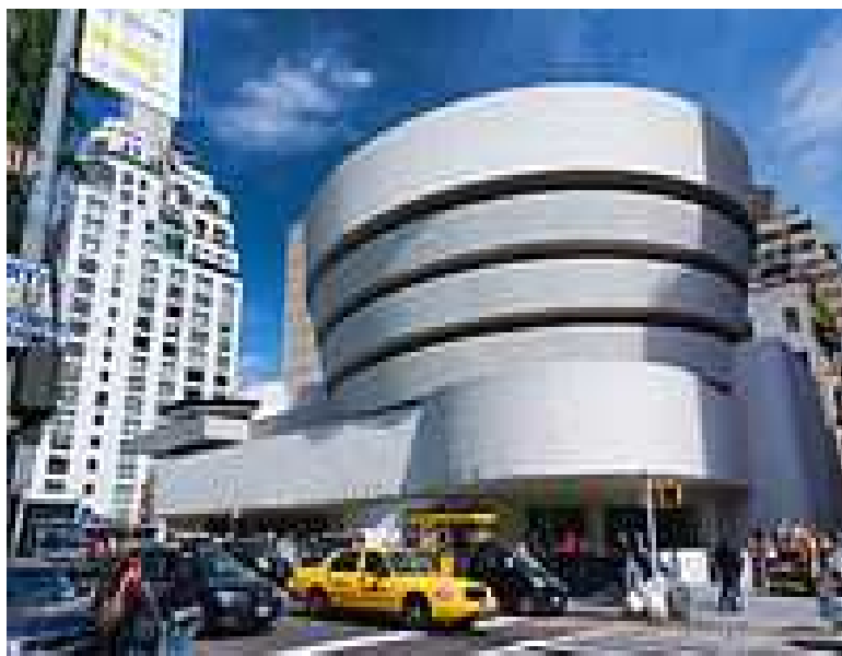
Slika br. 5: Muzej Guggenheim u New Yorku arhitekta F. L. Wrighta iz 1959. god. je jedna od prvih građevina izgrađenih isključivo kao muzej moderne umjetnosti.

stoljeća razvoja klasične umjetnosti, ona je razorena. Sada se velika se pažnja posvećuje sociološkim, sociološko-filozofskim, kulturno-filozofskim i kulturno-psihološkim pitanjima. 25