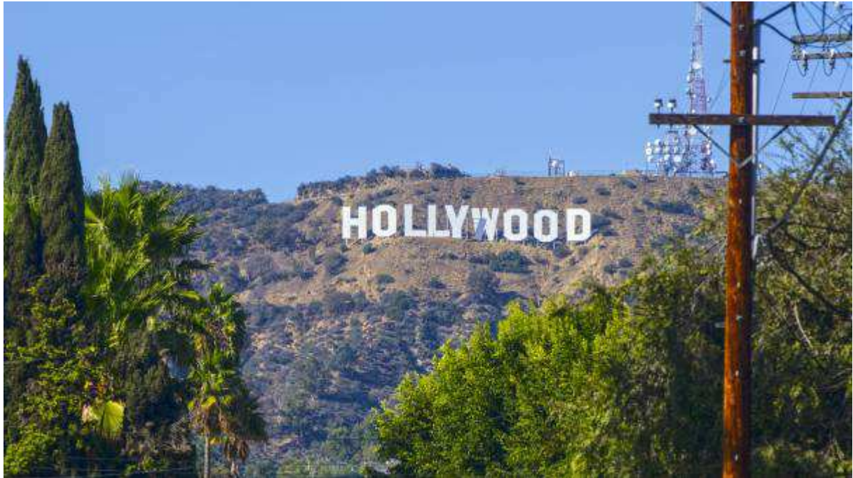
Slika 7. Hollywood, je ime gradske četvrti Los Angelesa SAD, koja je poznata po koncentraciji filmskih studija i kućama glumačkih( hollywoodskih ) zvijezda.

Nagrade su dobile potom popularni naziv „Oskar“. Tek kada je američki film postao izrazito superioran, nagrada „Oskar“ je počela da se dodeljuje svake godine i jednom filmu sa govornih područja u kojima nije osnovni engleski jezik, a to se dogodilo 1945. godine.