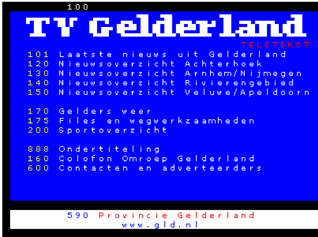
Slika 5. Teletekst

Posljednjih godina Internet je nadmašio teletekst, koji je sporiji, ima teži pristup, a grafike su grube i neuredne. U planu je sistem nadograditi i otkloniti sve nedostatke u pristupu, kao i da se stranice poboljšaju ugledajući se na Web, prikazujući statične slike, sa više boja i boljim grafičkim rješenjem. Ostaje vidjeti da li će teletekst preživjeti konvergencije televizije i Interneta.