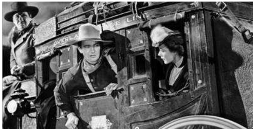
Slika 6. Detalj iz filma „Poštanska kočija“

Usporedno s tehničkim dostignućima, također su razvijale filmske vrste, žanrovi i razni stilovi. Film je postao medij privlačan masama, dostupan svim slojevima društva i prisutan u našim životima od najranijeg djetinjstva. Zabavlja nas, nadahnjuje, potiče na razmišljanje, uz njega odrastamo, živimo i učimo. Film je puno više od oblika umjetnosti. On je svojevrsno svjedočanstvo o svijetu koji nas okružuje i odgojitelj našeg vremena.