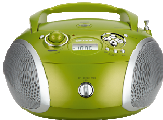
Slika 1. Grundig radio aparat

Radio valovi zauzimaju raspon od nekoliko desetina herca do 300 GHz, iako komercijalno važne primjene koriste mali dio ovog spektra.