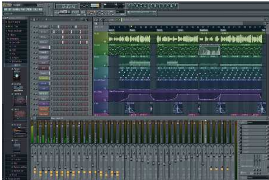
Slika 2. Program za pravljenje i miksanje glazbe

Cross-fade ili pretapanje koje znači postupno ubacivanje novog zvučnog izvora uz istovremeno izbacivanje starog i obično se primjenjuje za miksanje glazbe ili kao zvučni efekt u govornim dijelovima.