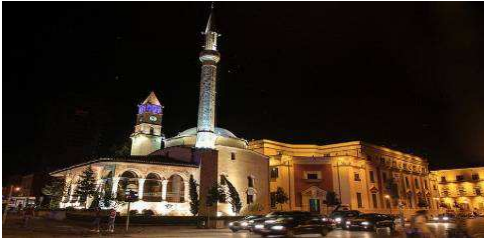
Slika 13: Et'hem Bey džamija