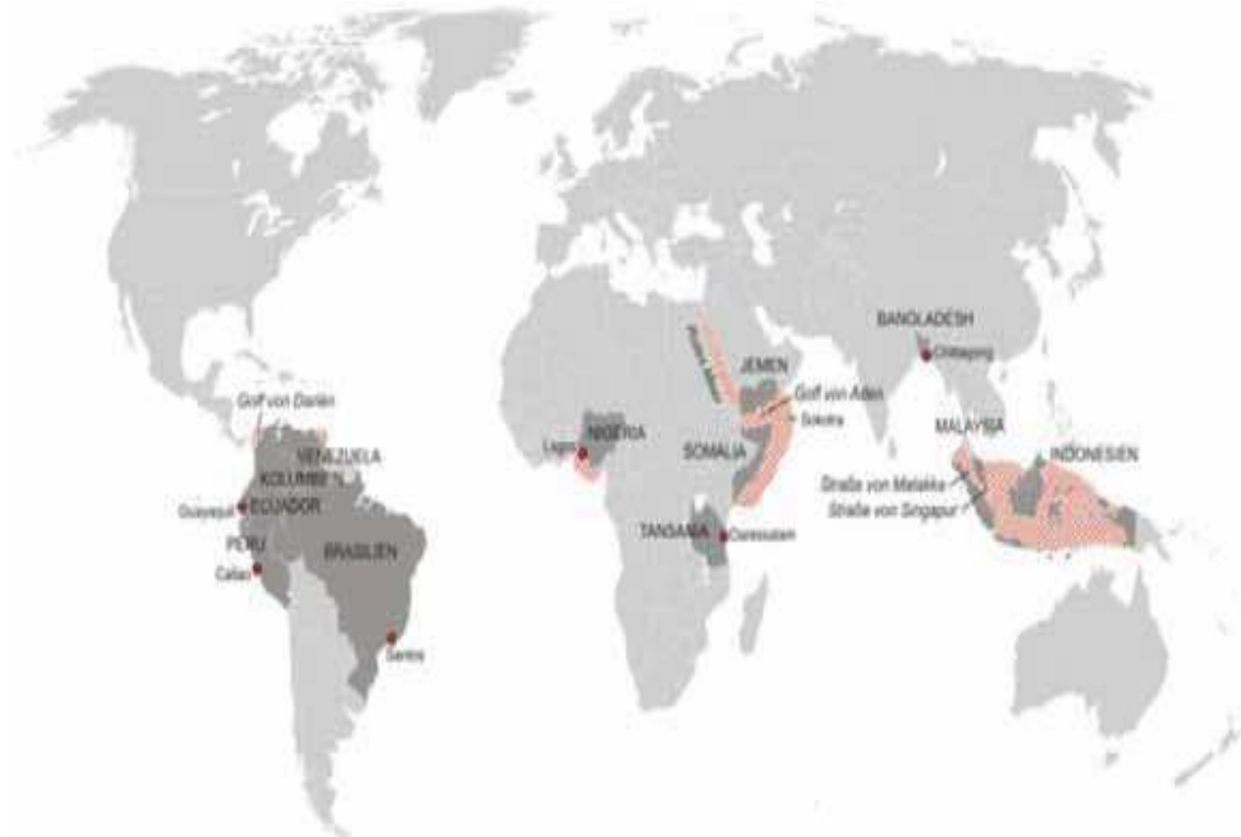
Slika 1. Krizna područja u svijetu

Analizom svih prijavljenih zločina u posljednjih desetak godina, savremeni pirati se ugrubo mogu podijeliti u dvije grupe: