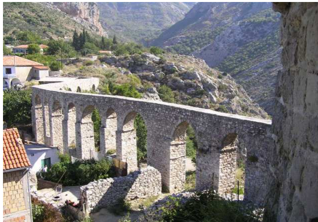
Slika 3: Akvadukt u Starom baru

Izgled i putanja akvadukta prilagođeni su konfiguraciji terena, i predstavlja jednu veliku građevinu koju čini 17 lukova koji se oslanjaju na isti broj stubaca. Na njegovoj gornjoj površini nalazi se kanal u kome su bile postavljene međusobno povezane keramičke cijevi za protok vode.