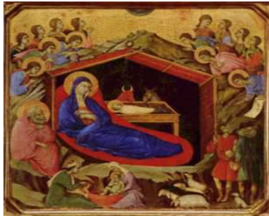
Slika 6: Rođenje Isusa Hrista

Božić 25.decembar po crkvenom, a 7. januar po novom kalendaru je najznačajniji praznik kojim se proslavlja rođenje Isusa Hrista.