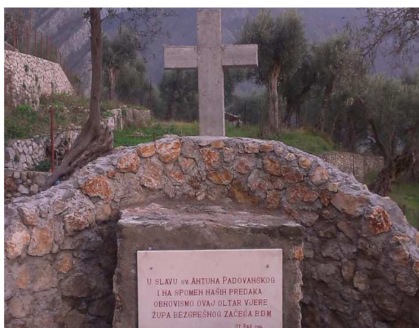
Slika 4:Obnovljeno crkvište Sv. Antuna Padovanskog

Crkva koja se pominje prvi put u XVII vijeku je crkva Sv. Anta, jer do tada na ovom objektu zbog turske zabrane nije bilo dozvoljeno postavljanje vjerskog simbola, u ovom slučaju krsta i zvona. U toj crkvi, obnovljeni su ostaci crkve Sv. Antuna Padovanskog, poznatija kao kapela Sv. Anta.