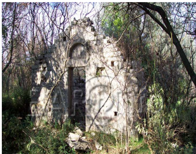
Slika 4: Današnji izgled crkve Sv. Katarine

U Barskoj opštini, crkva Sv. Katarine ubraja se u kulture treće kategorije.