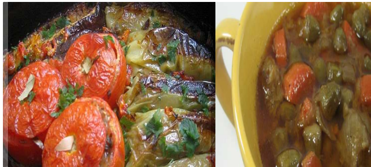
Slika 5: tradicionalna jela imam bajaldi i bamije

Što se tiče priča o pojediniom jelima u Starom baru, izdvaja se nekoliko, kao na primjer jelo imam bajaldi koji u prevodu znači jelo od patlidžana i maslinovog ulja.